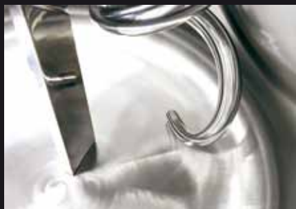
Piantone dritto Straight breaking column